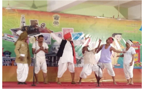
'यशवंता हरकारा' - मुंबई क्षेत्र के कर्मचारियों द्वारा प्रस्तुत नाटक की झाँकी