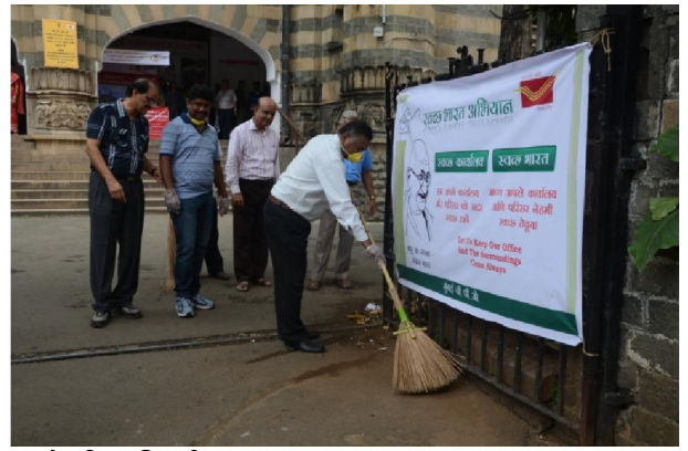
कार्यालय एवं परिसर स्वच्छ कर रहे वरिष्ठ अधिकारी