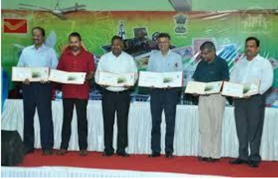
गरान पर विशेष आवरण का प्रकाशन

इस दौरान स्कूली बच्चों के लिए प्रश्नोत्तरी, वक्तूता, निबंध लेखन और चित्रकला प्रतियोगिताएं आयोजित की गई।